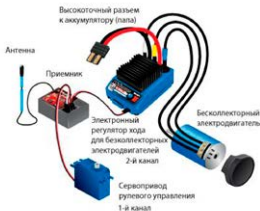
Схема подключения бесколлекторного электродвигателя